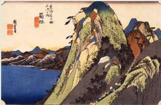
広重「東海道五拾三次之内 箱根 湖水図」

江戸時代の東海道の風情を残す箱根路の石畳と杉並木を歩きます。東海道で最大の難所とされた箱根八里ですが、今回は石畳の登り坂を1kmほど、ゆっくりと歩きますので、初心者でも安心です。広重も見たであろう箱根の山々と芦ノ湖の絶景も併せてお楽しみください。(全行程：約5.6km)