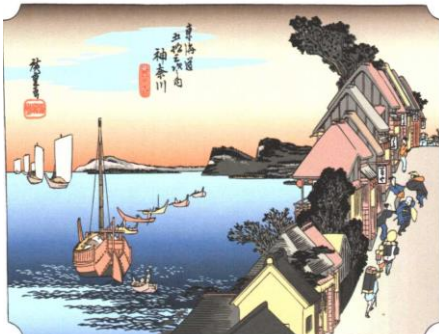
広重 「東海道五十三次之内 神奈川 台之景」

中世からの浦、品川と共に陸海交通の要衝として栄えてきた神奈川、江戸時代は合町からの内海「袖ヶ浦」の眺望は旅人の目を楽しませる東海道屈指の絶景地でした。しかし、嘉永六年(1853)ペリー率いる黒船の浦賀来航以降、歴史の大きなうねりの中に巻き込まれ、横浜開港という歴史的転換期の中心地の宿場町として大きな変貌を遂げました。そんな神奈川宿、往時の面影を偲びながらガイドと共に歩きませんか!