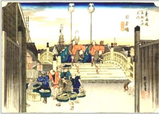
広重 東海道五三次之内日本橋朝の景

現代の旅の始まりは、東京駅から。北町奉行所、熙代勝覧(絵巻)、江戸の中心・日本橋、京橋、銀座を経て汐留へ一声の新橋停車場跡まで、年々大きく変わる東京の真ん中に、江戸の息吹を探す半日コースです。