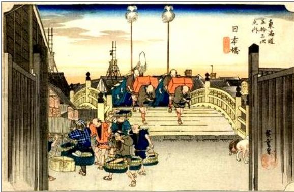
広重 東海道五三次之内日本橋 朝の景

旅の始まりは、日本橋。 江戸の中心日本橋から、京橋、銀座を 経て汽笛一声の新橋停車場跡、江戸庶 民娯楽の地だった芝神明界限、徳川家 の菩提寺増上寺に至る半日コースです。 旧東海道の旅へガイドがご案内。